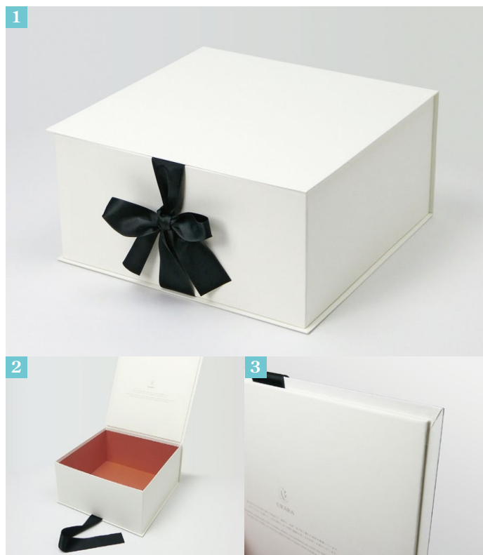
①ブック型の貼箱。様々なフルーツに対応する大きめサイズです。 ②蓋を開けた状態。中箱外寸：約W300mm×D300mm×H150mm。 ③高級感がありつつも暖かみがある色合い。

リボンは結びやすい太さや材質、高級感にこだわりつつも、パッケージ全体の価格を抑えられるよう、ヘルベチカ様よりご支給いただいたものを使用しております。