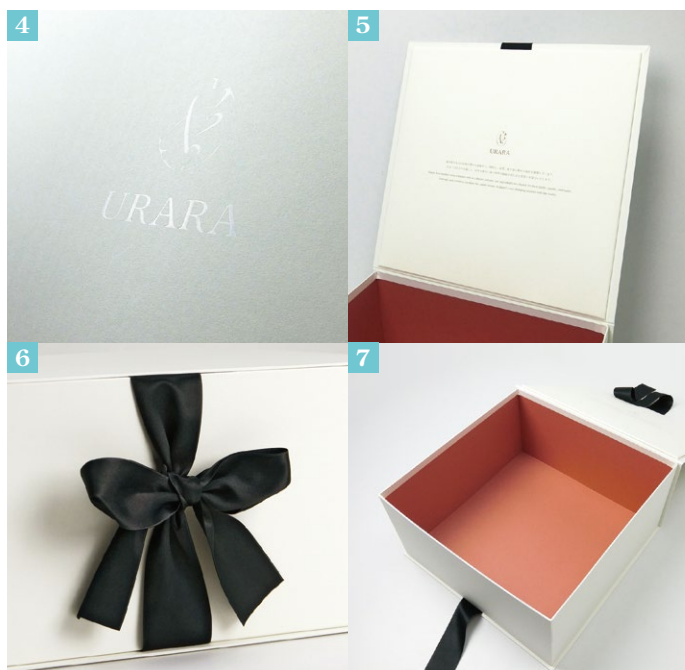
④上品で主張しすぎない、ツヤありの白箔でロゴが印刷されています。 ⑤蓋を開けると、裏にはメッセージが書かれています。 ⑥リボンを解いて蓋を開ける瞬間はワクワクします。 ⑦あずき色の内面がとてもオシャレなデザインです

貼紙の質感や色味など、様々なサンプルをご確認いただきながら、華やかなフルーツたちに負けない、細部までこだわりが詰まった高級感のある化粧箱に仕上げることができました。