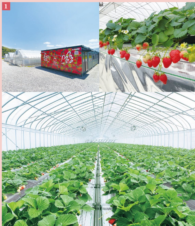
①「温泉いちご」栽培を手がけるメイワファームHYBRID。