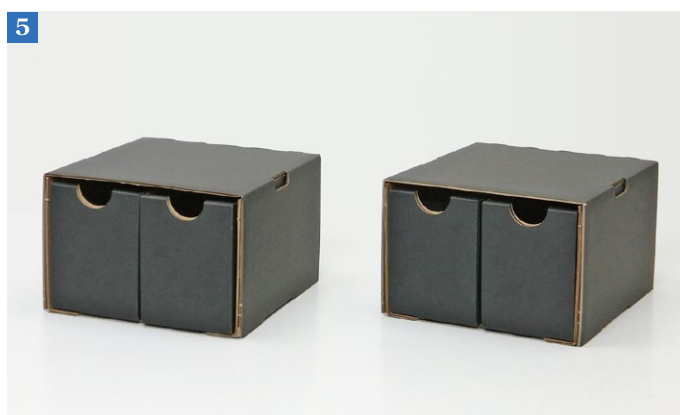
⑤材質：黒ライナー×K5 棚：B/F 引き出し：E/F