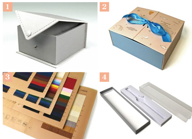
①スナップボタン加工【貼箱素材：紙＋合皮 その他ステッチ加工】