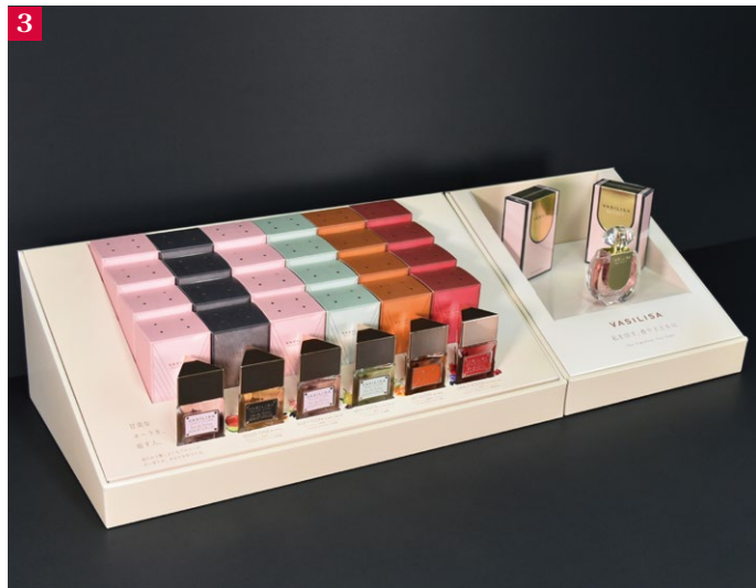
③W600+W300什器全体。限られた什器寸法の中で、展示されるテスター・商品を最大限にアピールしつつ、説得力のある訴求スペースを確保しています。

ご依頼いただきました。この什器は、売り場の設置面積にあわせそれぞれ単体でも使用できます。