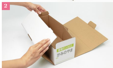
①【化粧箱3個入り】材質：白K6×120×K6 B/F フレキソ2色（グレー+特色） ②N式の形状です。蓋が一体型で簡単に組み立てができます。