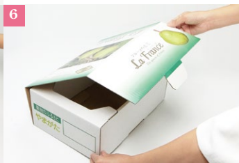
③【化粧箱2kg・3kg・5kg】身箱材質：白K6×中芯（2kg,3kg160g）（5kg200g）×K6 B/F フタ材質：印刷紙（+プレスコート）×C5 B/F