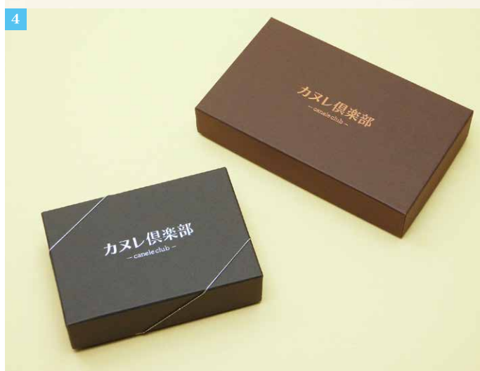
②Atelier Kato様 新作『クリーム生カヌレ』。 ③箱を開けた時、商品の見える高さにこだわって制作されました。 ④左：クリーム生カヌレ5個用パッケージ 右：生カヌレ15個用パッケージ。