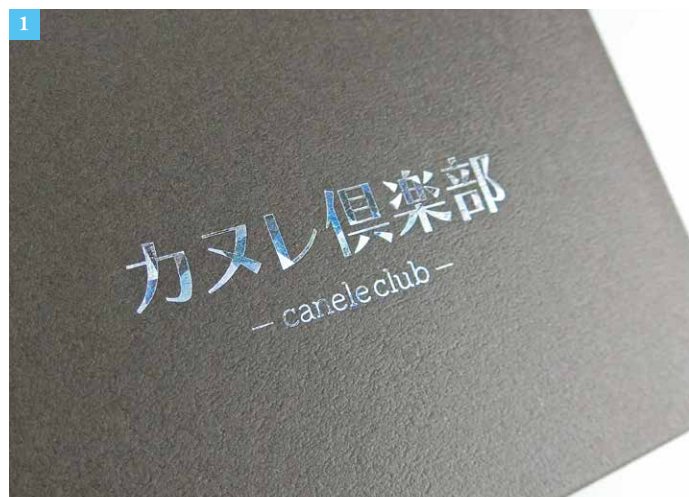
①ホログラムの箔押し。多面的に光が反射し、レトロなフォントが幻想的です。

パッケージは『貼箱（はりばこ）』と呼ばれる形状です。貼箱は、チップボードと呼ばれる硬い 1mm-2mm 厚の紙の芯材に、ファンシーペーパーや印刷紙を貼り付けて制作します。紙を貼り付ける段階で立体になり、箱になった状態で納品されます。納品後に板紙を折り曲げて仕上げる『組み箱』と比べると、芯材がしっかりしているので、強度が高い箱です。