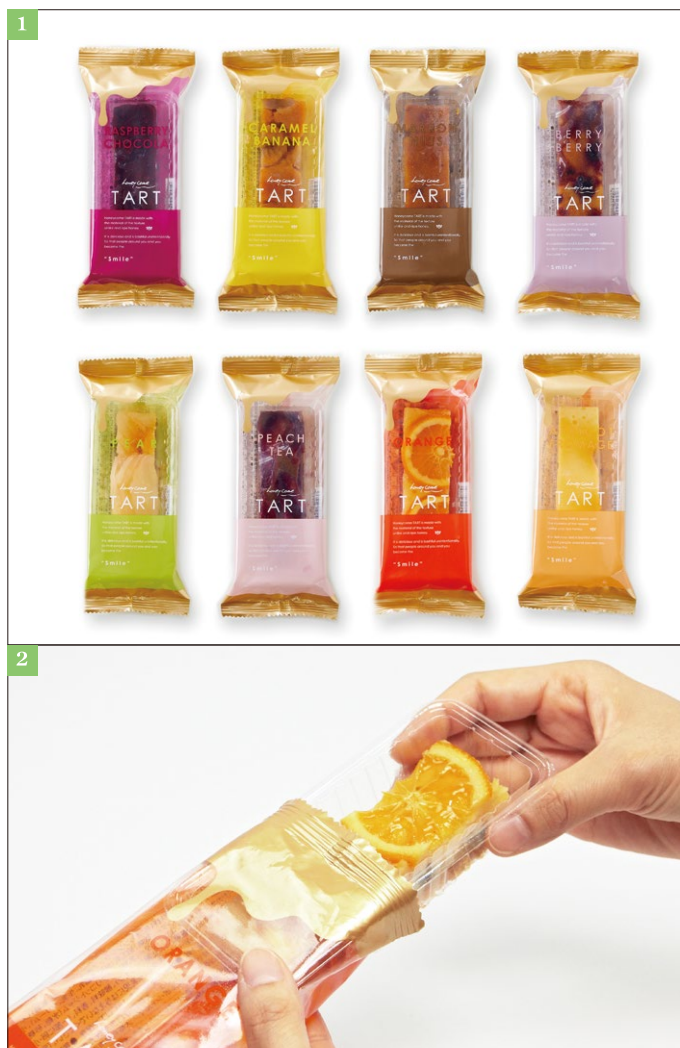
①“ハニカムタルト”【味8種】左上段からラズベリーショコラ/キャラメルバナナ/マロンナッツ/ベリーベリー/ペア/ピーチティー/オレンジ/アプリコットフロマージュ ②大阪で採取した完熟生はちみつを始め厳選素材が使われた、こだわりのタルト。

お打合せでは、サンプルにて“見づらい点が無いか・文字を何色にするか”など、細部に至るまでご確認いただきました。例えば、デザイン時では白色の文字だった箇所は、読みやすいように黒色に変更されています(写真③)。フィルム印刷では、ベースに白色のインクを引くことで透過度が変わりますが、カラーのみで文字が読みにくかった箇所には白引きを入れるなど、ベストな仕上がりになるよう調整いただきました(写真⑤)。最終量産時には、お客様のデザインイメージ時の色合いを再現する点に注力いたしました。