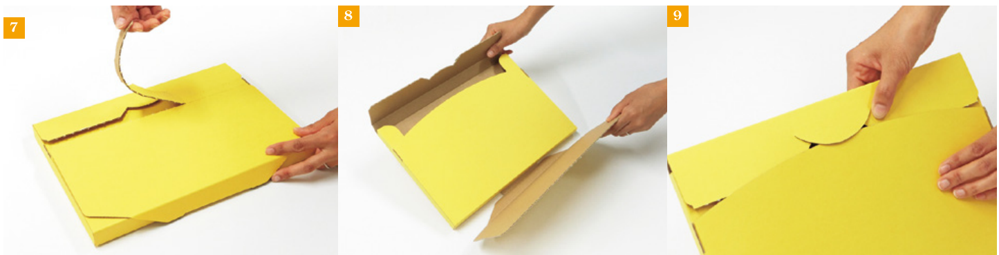
⑥【伝票切り離し型】 TM-002。 ⑦ジッパー付で簡単に開封できます。 ⑧伝票がついているフタは取り外せます。 ⑨再びフタ閉じて使用できます。