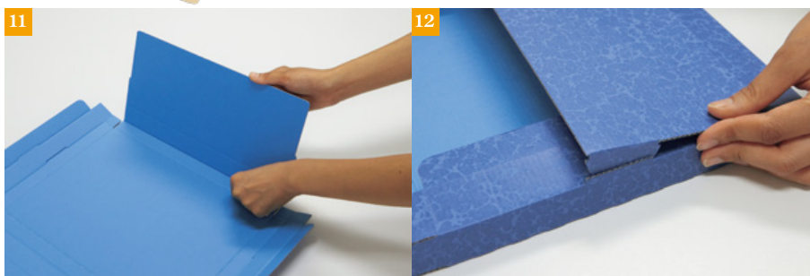
13 ⑩【60サイズ可変ケース】 TM-003 ⑪発送サイズに合わせて折り曲げます。 ⑫サイドを立ち上げ、フタを差し込みます。 ⑬残りのフタを折り、テープで閉じてご使用ください。