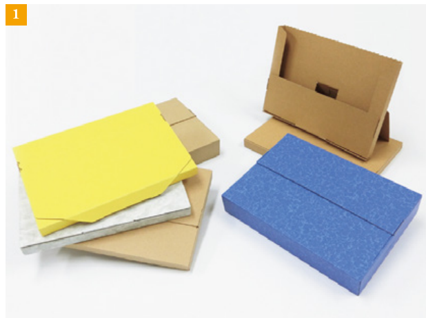
①ベーシックなクラフト色以外にも、“ダンボール色を変える”“オリジナル印刷”も可能です。

箱型 11 種・宅配袋 3 種と全 14 種ありますが、今回は設計するにあたり、「利便性がある」「強度がある」「誰にでも組み立てられる」をテーマに作り上げました、箱型 3 点についてご紹介させていただきます！