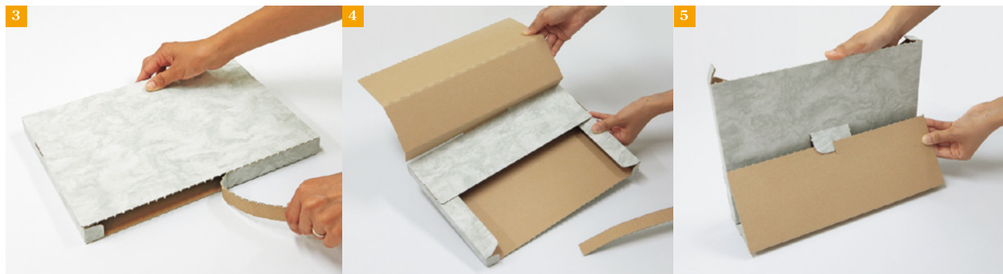
②【横置きスタンド型】 TM-001。 ③ジッパー付で簡単に開封できます。 ④フタを折り返していきます。 ⑤後ろにまわし、切れ込みどうしを差し込みます。