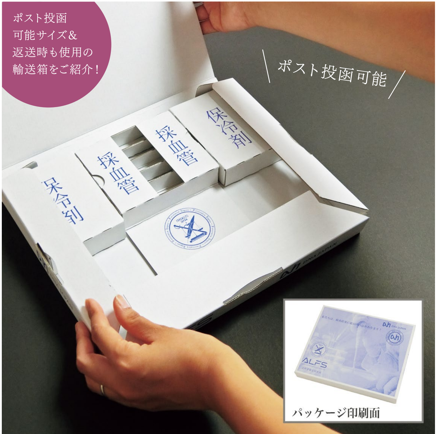
パッケージ印刷面