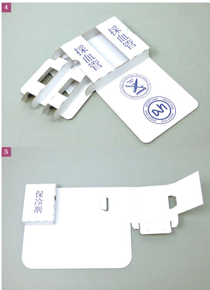
④採血管を入れる箱、仕切りと窓がついている。

また、エンドユーザー様へ検査キットを送った後は、検査をする為に採血管や保冷剤を入れた箱をエンドユーザー様から返送にも使用できるようにとのご要望もありました。