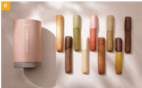
⑥CHUYOCO_チョコレートサンド 全16種。 ⑦KIMOCCHI_パウンドケーキ 全6種。 ⑧ICHIZU_フィナンシェ 全9種。