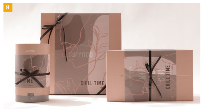
⑨sign. ウェブショップほか、大阪 大丸梅田店にてお買い求めいただけます!