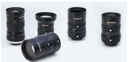
取り扱いFAレンズ“FA LENS UNIT”