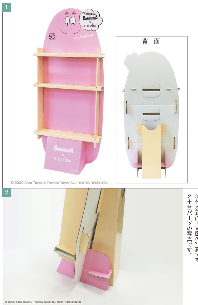
①什器正面・背面の写真です。 ②土台パーツの写真です。

このような紙製什器のメリットは荷姿をコンパクトにする事ができ、輸送コストの優位性が高い事が魅力です。今回ご依頼いただきましたこの什器も、荷姿を常に意識した設計となりました。(完成時 470×300×H1060 mm、折畳時 480×440×H50 mm) 組み立て簡単、もちろん強度もキープしております。構造的にはラフな木製棚のエッセンスを取り入れました。