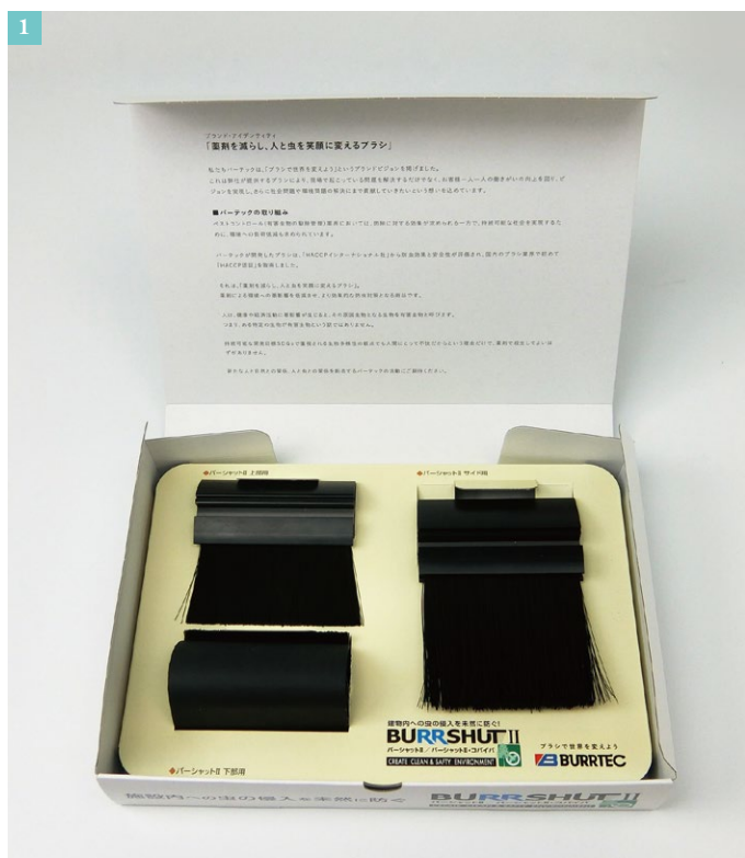
①箱を持ち歩いても、開けた時にはちゃんとサンプルが収まっています。

今回、バーテック様『隙間対策ブラシ』のサンプルケースの設計をさせていただきました。このシリーズに関わらせていただいて、もう4~5年になります。初回の設計時の打ち合わせを思い出します。