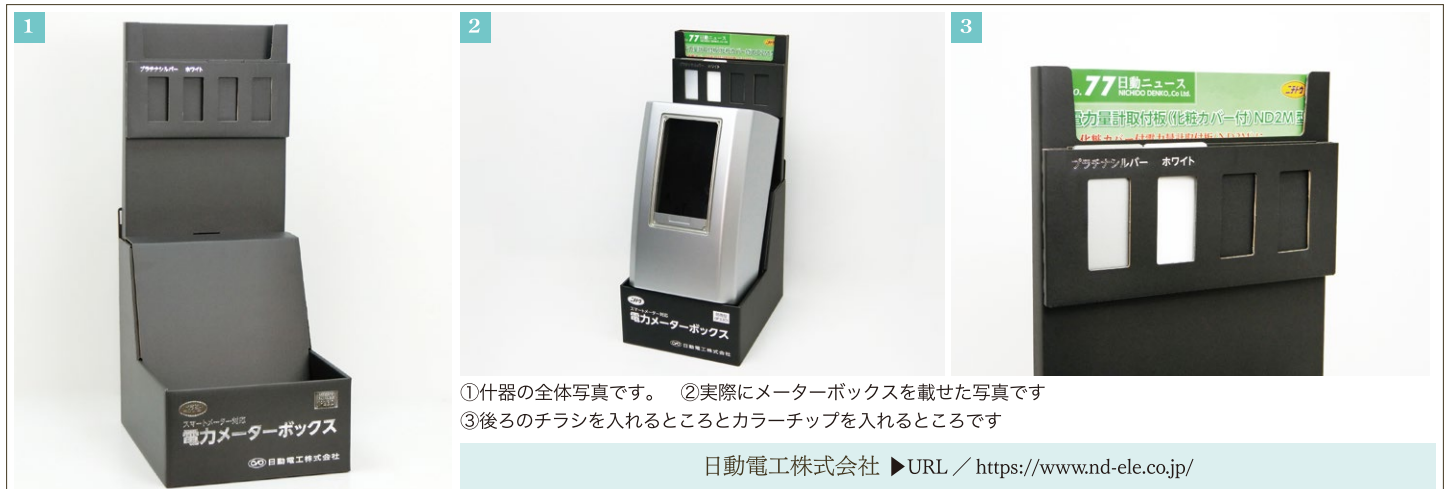
①什器の全体写真です。 ②実際にメーターボックスを載せた写真です ③後ろのチラシを入れるところとカラーチップを入れるところです

日動電工株式会社 ▶URL / https://www.nd-ele.co.jp/