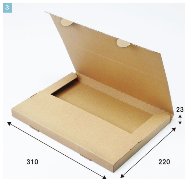
③ポスト投函対応サイズ 卓上スタンド(ヨコ型)。 ④印刷を入れることで訴求効果もあります。