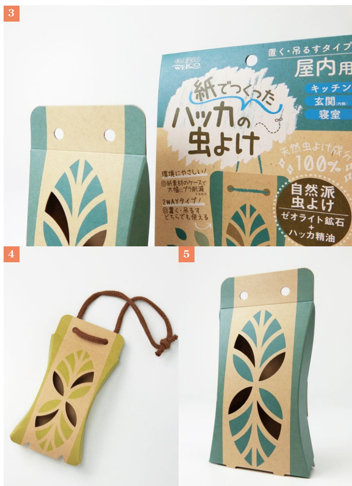
③クラフト調の板紙に特色使いのオフセット印刷でこだわりの色味を再現。 ④屋外用は吊り下げタイプ。⑤屋内用は置き型、吊り下げと兼用できる2WAYタイプ。

①差し込む部分にカーブ付けをし、紙の重なり避けの設計提案をしました。 ②耐水紙を使用し、底面には水滴が溜まらないよう底穴開けの工夫がされています。