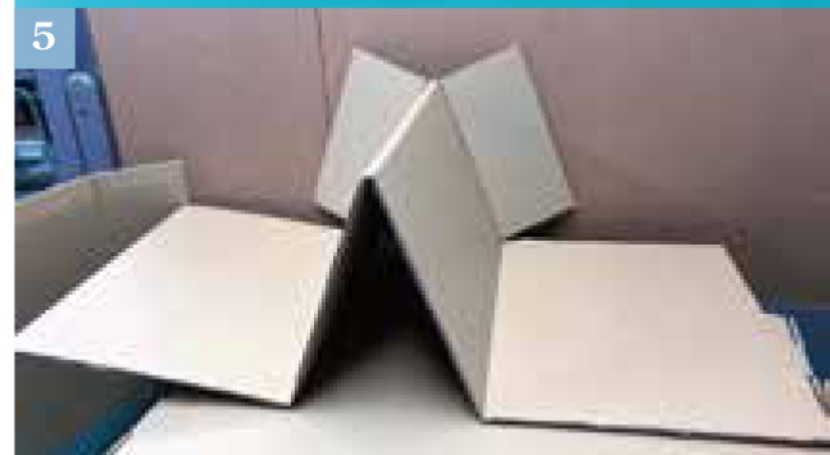
④商品全景（4分割使用時）。 ⑤取り付け取り外しが出来、4分割の仕切を使用しなくても倒れない工夫をしています。