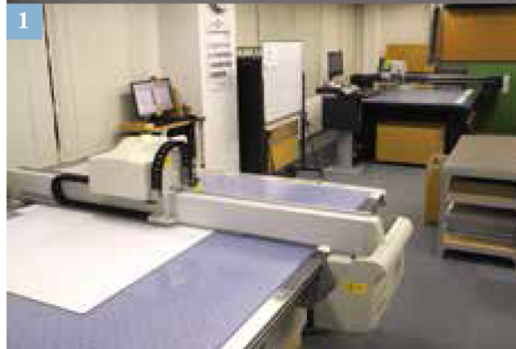
①新型機。 ②奥が新型機。手前は1号機。